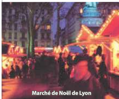
Marché de Noël de Lyon